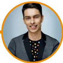
Андрій Черновол телерадіоведучий, ведучий каналу М1 та «Русское Радио Україна».