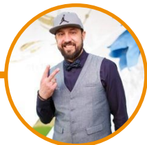
Андріс Капінш голова журі.

Протягом відбіркового етапу ми отримали понад 900 заявок на участь . Серед них члени професійного журі відібрали 208 півфіналістів , які у червні поїдуть на фестиваль.