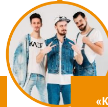
Гурт «Клей Угрюмого»