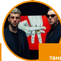
Львівський танцювальний клуб